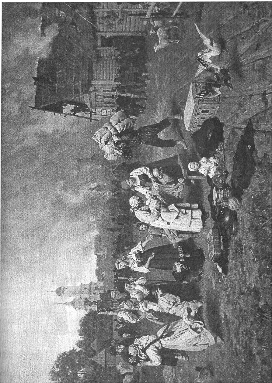
1. Н.Д. Дмитриев-Оренбургский. Пожар в деревне. 1879 г. Репродукция из альбома