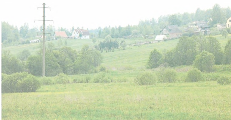
Вид на д. Пречистино со стороны Дворикувского шоссе.