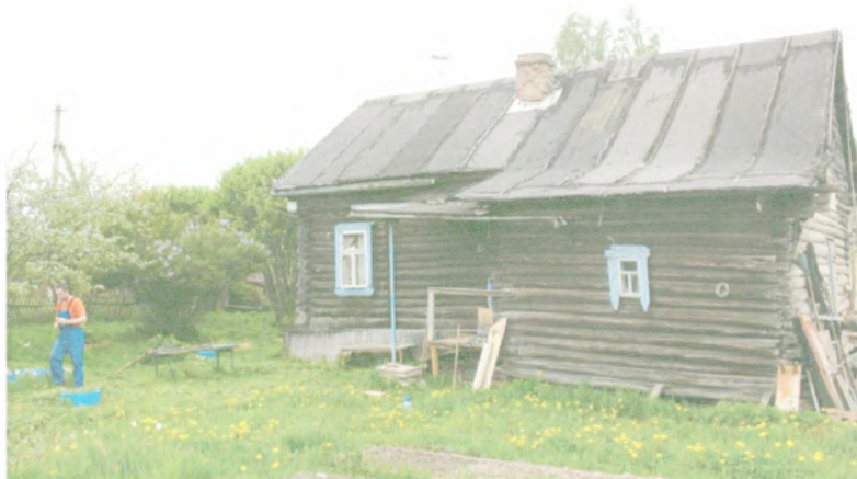
Дом местного жителя, д. Пречистино.