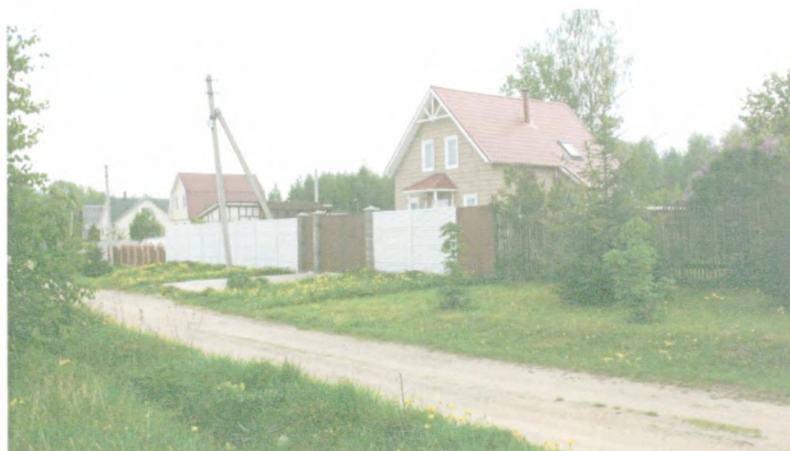
Дома садового товарищества рядом с д. Пречистино.