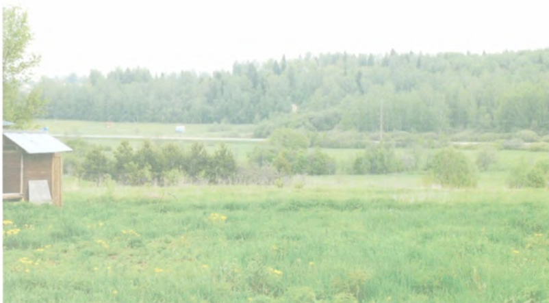
Вид на долину р. Верхдубенки, в прошлом Дубенки, со стороны д. Пречистино.