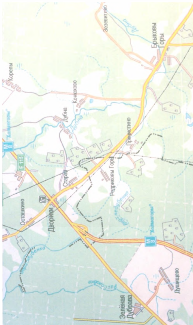
Пречистино - 1